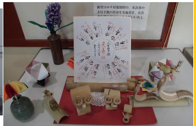
じゅさんふくかい 寿山福海